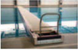
Both the Olympic swimming pool and the training swimming pool have been realized by CEMI with STEELA technology.

STEELA es un procedimiento absolutamente revolucionario, puesto a punto por CEMI a través de su compromiso, experiencia y su constante actividad de investigación. Esto ha señalado un cambio estructural sin precedentes en el seno del proceso de organización del trabajo y permite hoy de construir en tiempos breves piscinas de todas formas, dimensiones y usos, garantizando una resistencia y una precisión superiores. La piscina olímpica de Casa del Agua es la confirmación de eso. Larga 51,14 metros y ancha 25 metros, ha sido definida uno de los elementos más espectaculares de todo el complejo, junto a la de calentamiento ideal para niños y mayores. Pero ¿que hay bajo de un éxito tan grande?